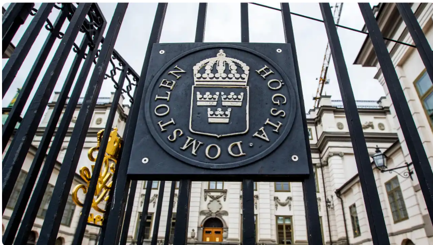
Högsta domstolen i Stockholm.

Sedan straffbestämmelsen infördes 1949 har tröskeln för brottsliga yttranden vidgats till att omfatta fler grupper och tröskeln för vad som ska anses straffbart sänkts. Begreppet ”smädelse” utmönstrades 1970 då det ersattes med ”missaktning”.